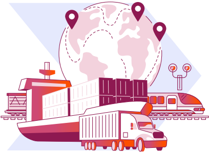
Denizler ve iç sular, kara yolları ve demir yollarında faaliyet gösteren nakliye şirketleri