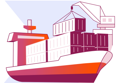
Nihai alıcılar (deniz taşımacılığında)